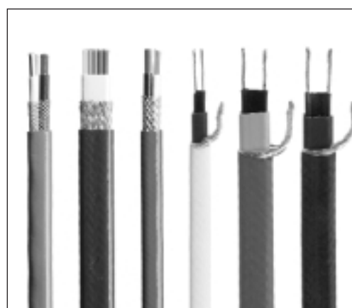
Välj mellan ohmsk eller självbegränsande värmekabel beroende på användn.område.